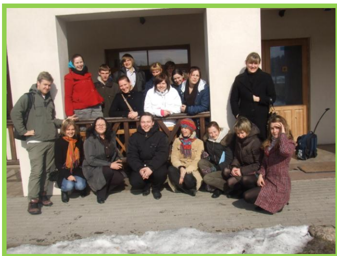
Foto: semināra dalībnieku kopbilde saulainā aprīļa dienā.