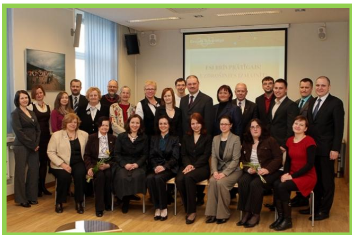
Izglītības un zinātnes ministrs Rolands Broks (centrā) kopā ar Eiropas Brīvprātīgā darba gada labas gribas vēstniekiem

Runājot par vēstnieka misiju, R.Broks atzīmēja: „Diplomātijā vēstnieks ir persona, kas pārstāv, popularizē un aizstāv savu valsti. Taču vēstnieka darbā var rasties situācijas, kad ir dažādi viedokļi, dažādas darbības un tad vēstnieks ir tas, kurš risina jautājumus un rod kompromisus”. Ministrs novēlēja visiem Eiropas gada labas gribas vēstniekiem veiksmi, pildot šo misiju un pauda pārliecību par sekmīgu sadarbību.