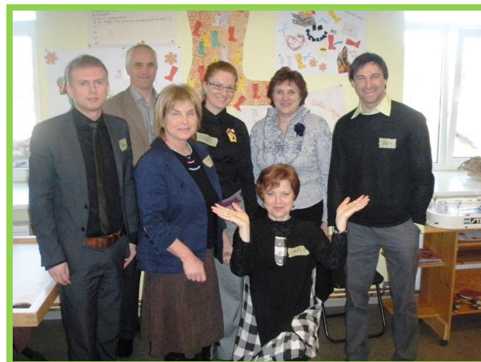
Foto: Pļaviņu novada jauniešu centrā „Ideja”, jaunatnes lietu speciāliste

„Jaunatnes politika ir atbilde tam, kā noturēt jauniešus Latvijā un dzimtajos novados! Foruma un pašvaldību vizīšu laikā kopīgi ar pašvaldības pārstāvjiem, citām darbā ar jaunatni iesaistītajām personām un jauniešiem meklējām atbildes, kā uzlabot jauniešu dzīves kvalitāti Latvijas reģionos,” atzīst biedrības „Jauniešu konsultācijas” priekšsēdētājs J. Logins.