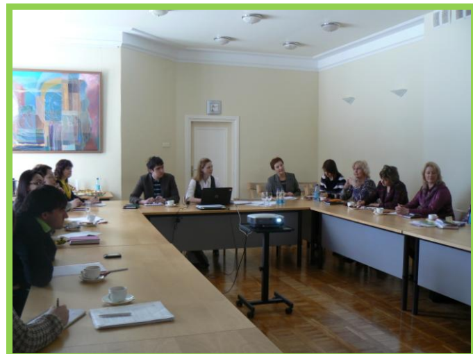
Foto: Tikšanās Valmieras pilsētas domē.