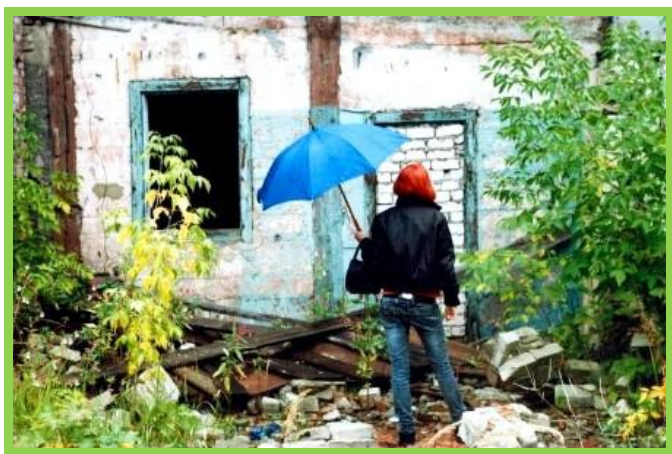
foto „Risinājums” - ir nepieciešamas jauniešiem draudzīgas atpūtas vietas

Rēzeknes pilsētas Izglītības pārvalde jau tradicionāli rīkoja Jaunatnes demokrātijas pasākumu Rēzeknes pilsētas domē. Pasākumam bija 3 posmi, kur pirmajā posmā vairāk nekā 30 pilsētas skolu jaunieši 3-4 stundu garumā iepazīnās ar dažādu domes nodaļu darbu, otrajā posmā notika radoša aktivitāte – ideju kafejnīca „Veidosim kopā jauniešiem draudzīgu pilsētu” un noslēguma posmā tika atklāta jauniešu fotokonkursa „Zoom in” izstāde. Pasākuma galvenais mērķis - dot iespēju jauniešiem iepazīt domes darba vidi, paust savu viedokli par pilsētā notiekošajiem procesiem, kā arī stiprināt Rēzeknes jauniešu sadarbību ar pilsētas lēmējvaru.