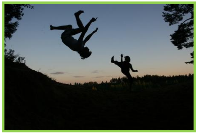
sportojot saulrietā