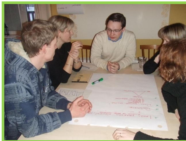
Foto: seminārā pamatā darbs notika grupās.

Semināra laikā tika skatīti jautājumi, kas saistīti ar brīvprātīgā darba organizēšanu un plānošanu pašvaldībās, kā arī brīvprātīgā darba atzīšanu un uzskaiti. Semināra programma tika veidota, balstoties uz pašu semināra dalībnieku izvirzītajiem izaicinājumiem brīvprātīgā darbā: jauniešu motivēšana iesaistīties brīvprātīgajā darbā, sabiedrības izpratnes maiņa par brīvprātīgo darbu, brīvprātīgā darba organizēšana (tiesiskais ietvars, brīvprātīgā darba piedāvājums un novērtējums).