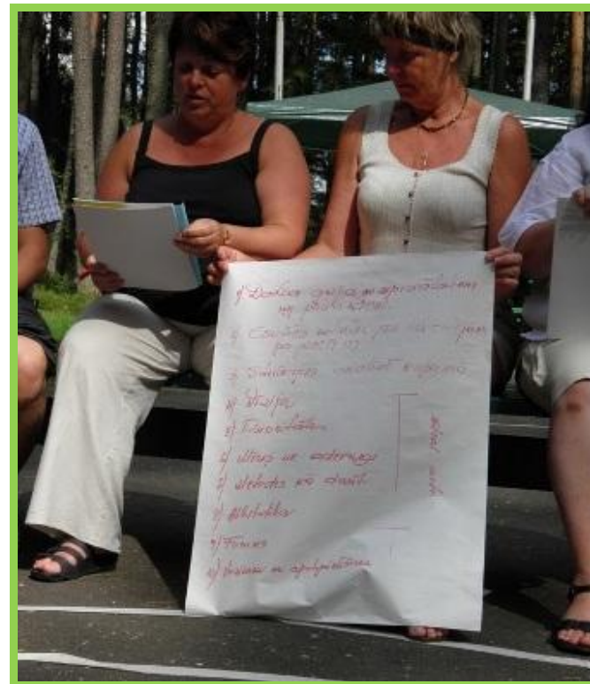
Foto: no pieredzes apmaiņas semināra Daugavpils novadā par stratēģijas izstrādi

Kāpēc tik svarīga ir vīzija? Lai varētu sasniegt izvirzītos mērķus, prioritātes, mums skaidri jāzina, ko mēs vēlamies sasniegt un ko mainīt. Tādēļ noteikti aicinām arī Jūs pašus atbildēt uz šādu jautājumu: Kādu jauniyeti savā pašvaldībā Jūs vēlētos redzēt? Kad būs gatava atbilde, tad varēs jau strādāt pie konkrētām rīcībām un aktivitātēm. Diemžēl ne vienmēr mēs spējam atbildēt uz šādu jautājumu, jo nezinām ar ko sākt veidot jauniešu portretu un kādā veidā izvēlēties labākos mērinstrumentus. Bet vīzija ir būtiska, jo tieši tā iedod pievienoto vērtību izstrādātajam dokumentam un kalpos par pamatu tam, lai pēc noteikta laika perioda, mēs varētu secināt, vai izstrādātā stratēģija ir realizēta un ko tieši mēs esam mainījuši, pateicoties šāda veida dokumentam.