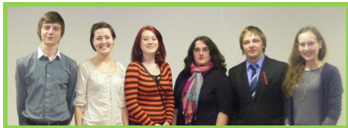
Foto: jaunā LJP valde

2011. gada 4. aprīlī Latvijas Jaunatnes padomei notika ārkārtas kongress, kurā tika ievēlēta jauna valde: